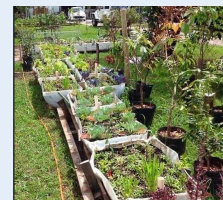
Horta com Vasos e Canteiros Pequenos