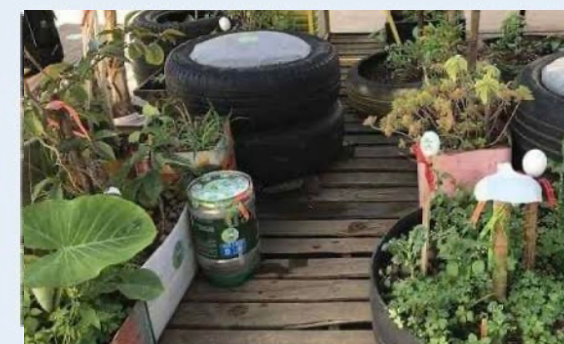
Horta Urbana com Pneus e Latas