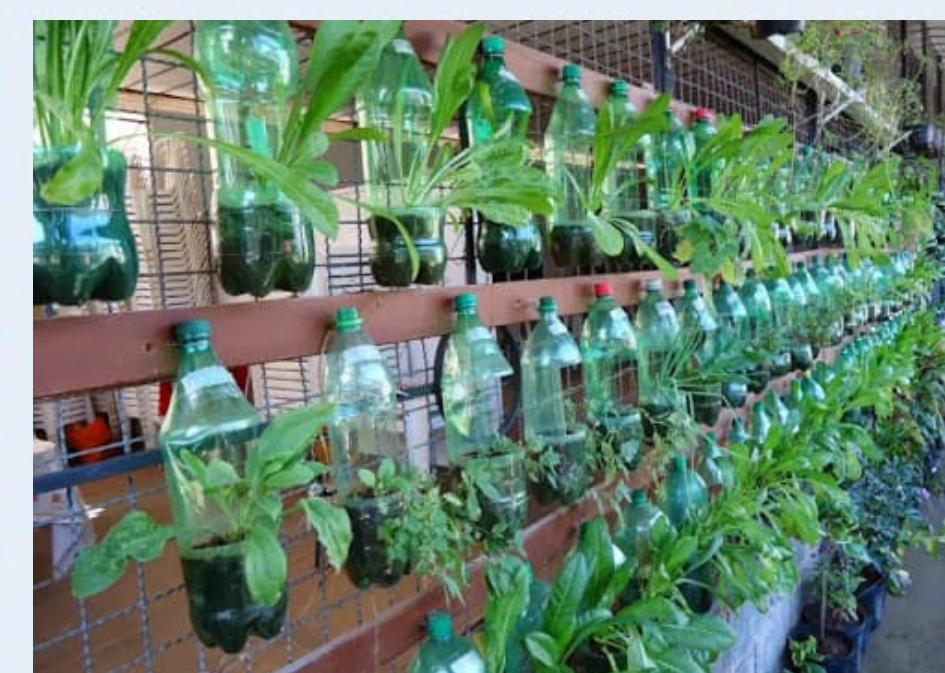
Horta Urbana Suspensa