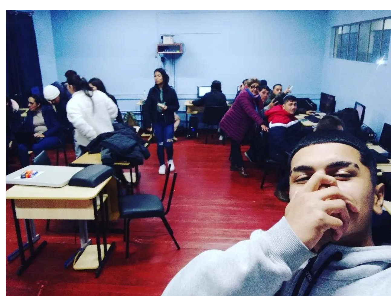
Figura 1. Pesquisa bibliográfica e produção dos slides para socialização