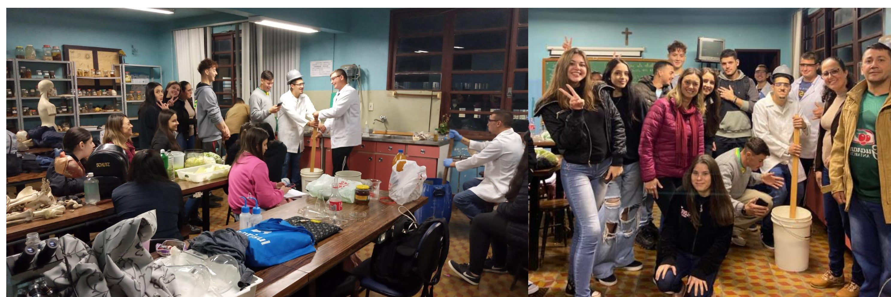
Figura 2 e 3. Produção do sabão