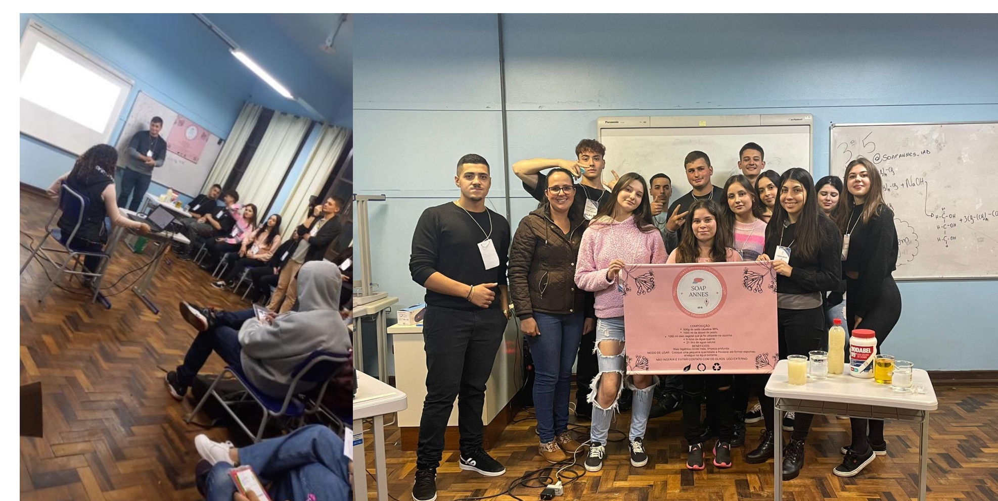
Figura 4 e 5. Socialização dos resultados