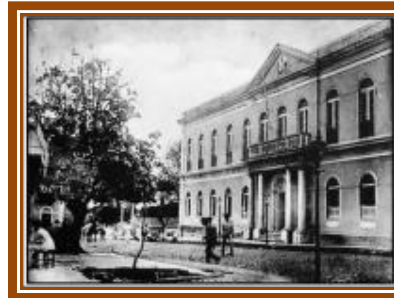
Assembleia Provincial do Ceará, atual Museu do Ceará. (1871) Construída em estilo Neoclássico. (Foto processada digitalmente).

A arquitetura neoclássica no Brasil, influenciada pela chegada da Missão Artística Francesa em 1816, desempenhou um papel fundamental no desenvolvimento da arquitetura no país. Este estilo arquitetônico, embora menos detalhado do que o neoclássico europeu, produziu obras marcantes com relevante simbolismo, abrangendo diversas regiões brasileiras.