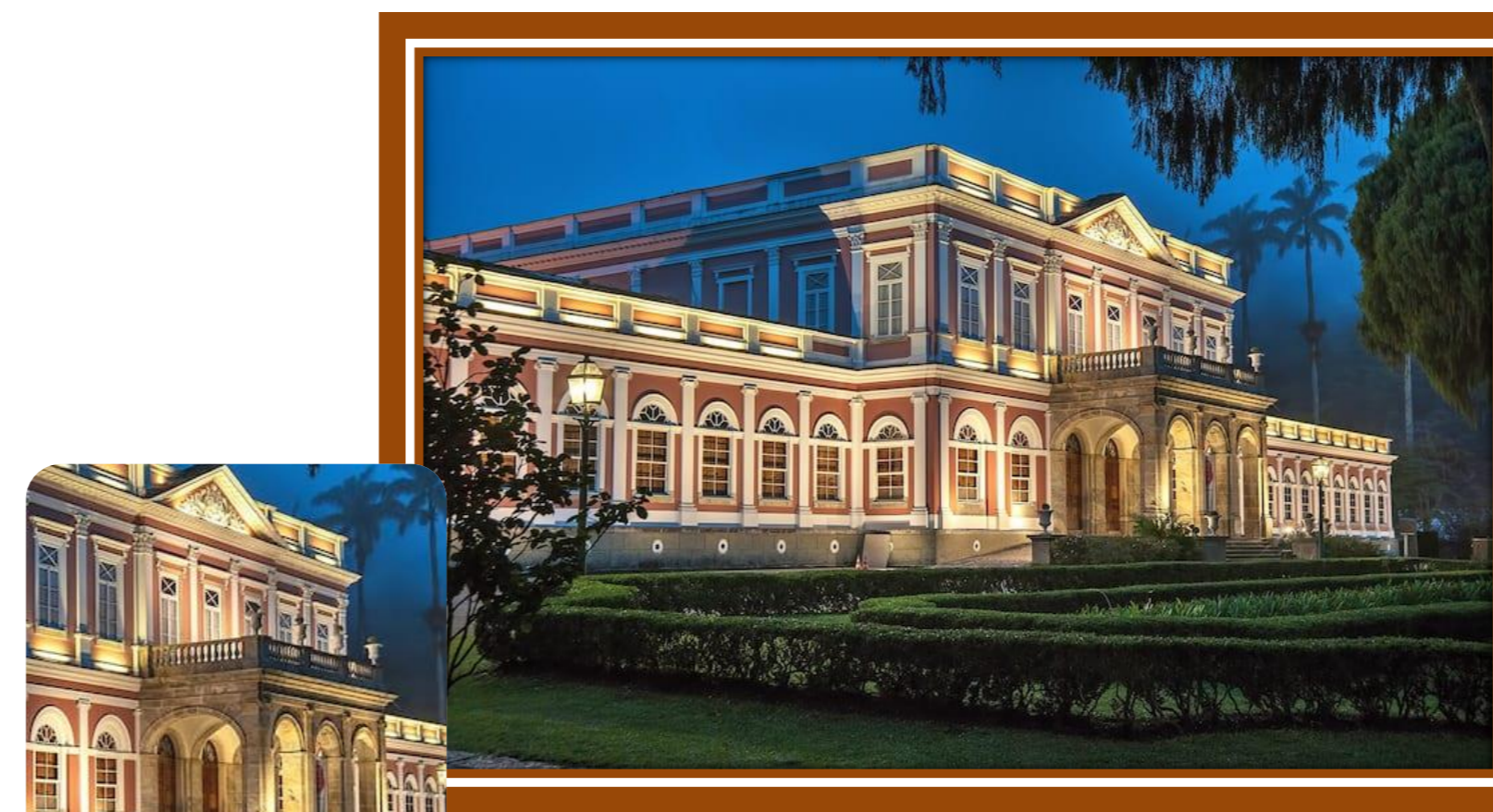
Museu Imperial – Rio de Janeiro

Tal estilo conseguiu se adaptar a então colônia, mesclando-se a arquitetura preexistente no país criando uma nova vertente ao estilo, provendo uma nova forma de edificar, aliando a arquitetura e engenharia europeia, africana e sul-americana. Nota-se que tal estilo sofreu um "empobrecimento" já que devido à menor disponibilidade de recursos materiais e financeiros, assim como o déficit na mão de obra qualificada, forçando a utilização em menor escala de orçamentos e materiais nobres como mármore e ouro. Mesmo assim, o estilo manteve sua grandiosidade e elegância.