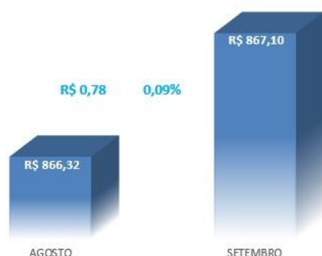
Figura 1- Evolução do preço da Cesta Básica na cidade de Cruz Alta-RS