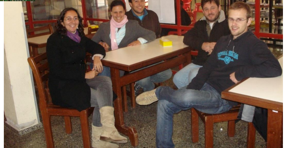
Projeto de Extensão “Luz, Câmera, Ação, Edição e Intervenção: o meio ambiente não conhece fronteiras” (2011)