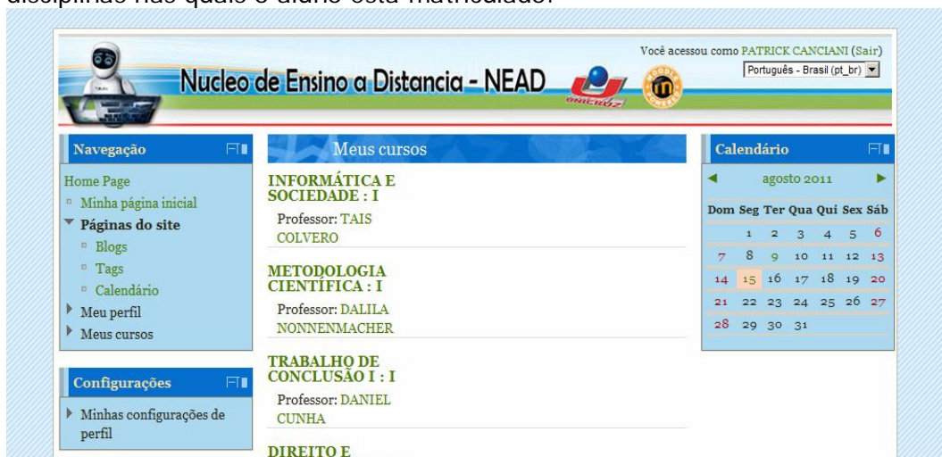
Figura 3 – Disciplinas

Após será visualizada uma tela semelhante à da figura 3, que lista as disciplinas nas quais o aluno está matriculado.