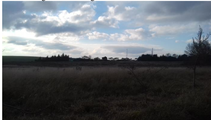
Figura 02 – Fotografia do terreno em estudo