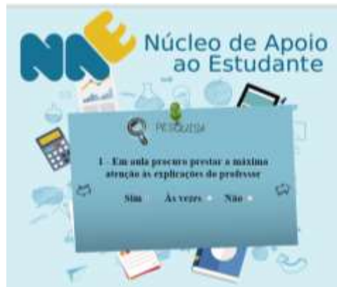
Figura 1. Tela Questionário

O sistema atualmente encontra-se em fase de testes, já foram aplicados os testes do tipo caixa branca, ou seja, estes testes foram realizados pelo programador. Após estão sendo aplicados os testes do tipo caixa preta, ou seja, testes realizados pela população em geral. O sistema foi aplicado na turma de Lógica para Computação integrante do curso de Ciência da Computação. Vinte alunos participaram da pesquisa, conforme a Figura 2.